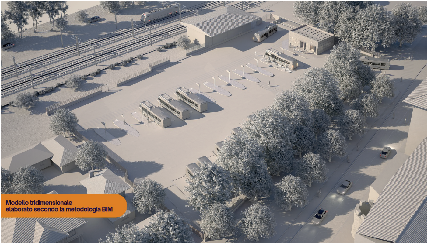
Modello tridimensionale elaborato secondo la metodologia BIM